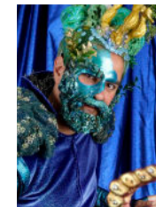
Bashkim Neziraj Havskungen